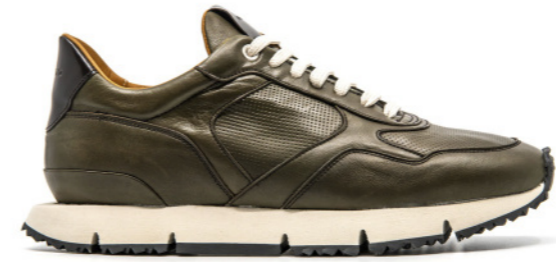
LEWIS 42345 OLIVE