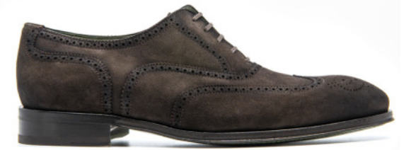
SAINT-ETIENNE 42310 TESTA