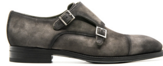
MORITZ 42314 ASH