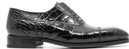
SAINT-ETIENNE 42309 BLACK