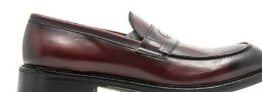
MOSCOW 42325 BURGUNDY