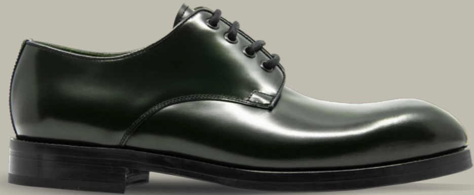
EAGLE 42297 DARK GREEN