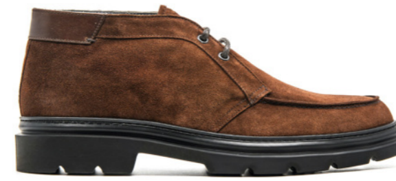
BERGAMO 42338 RED CLAY