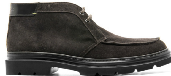
BERGAMO 42339 TESTA