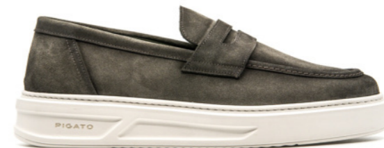
MONACO 42351 GREEN GREY