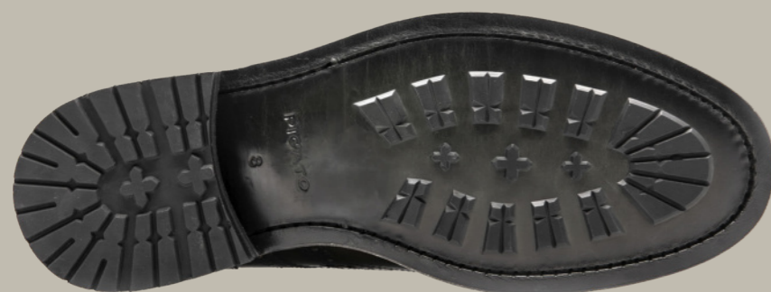
LEATHER SOLE AND INJECTED TPU