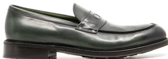
MOSCOW 42326 GREEN BOTTLE