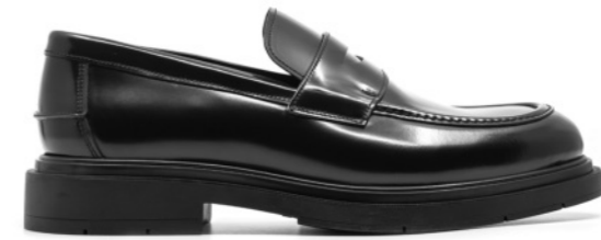
OSLO 42328 BLACK