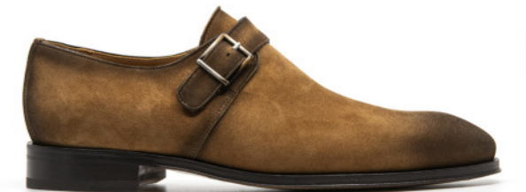
SAINT-ETIENNE 42312 WHISKY