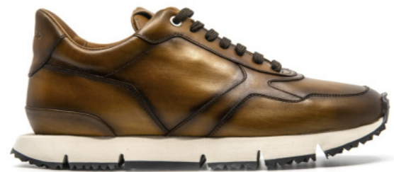
LEWIS 42347 MUSTARD