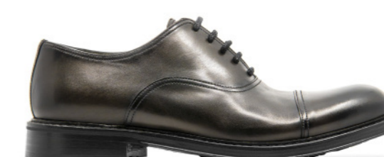
MOSCOW 42323 TESTA