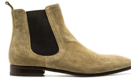
PARIS 42318 SAND