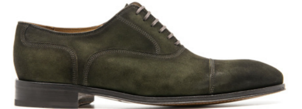
SAINT-ETIENNE 42305 FOREST