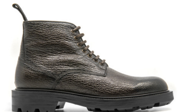
TIBET 42330 TESTA