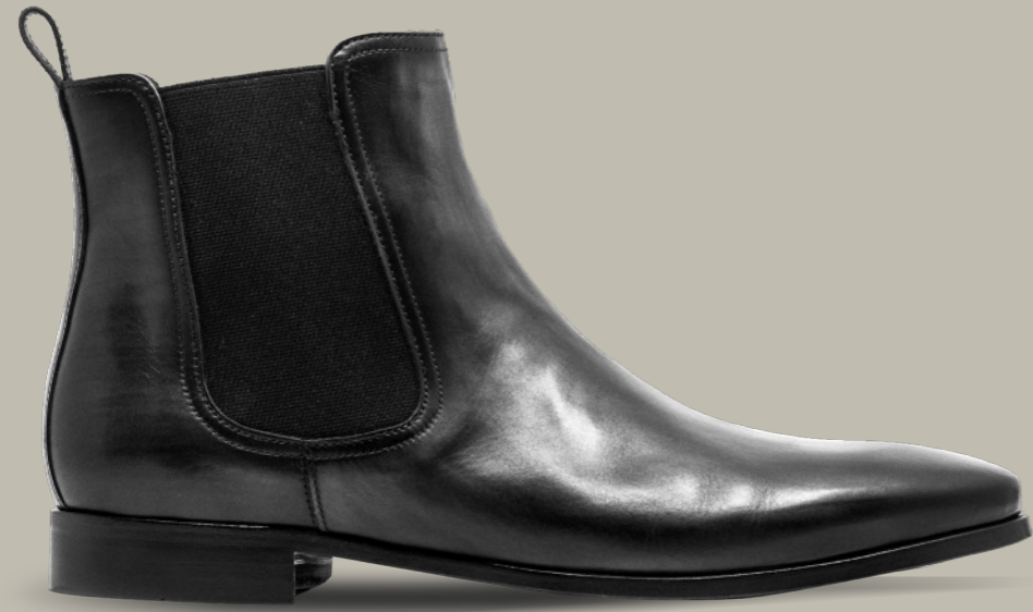
PARIS 42317 DARK GREY