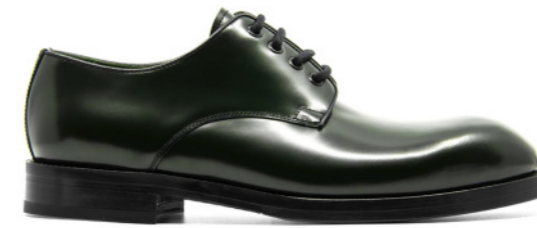
EAGLE 42297 DARK GREEN