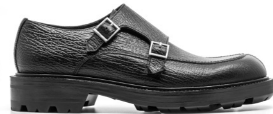
TIBET 42336 BLACK