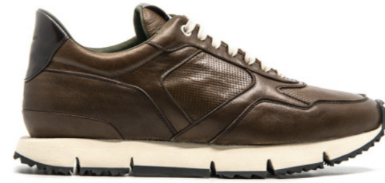
LEWIS 42344 CHOCOLATE