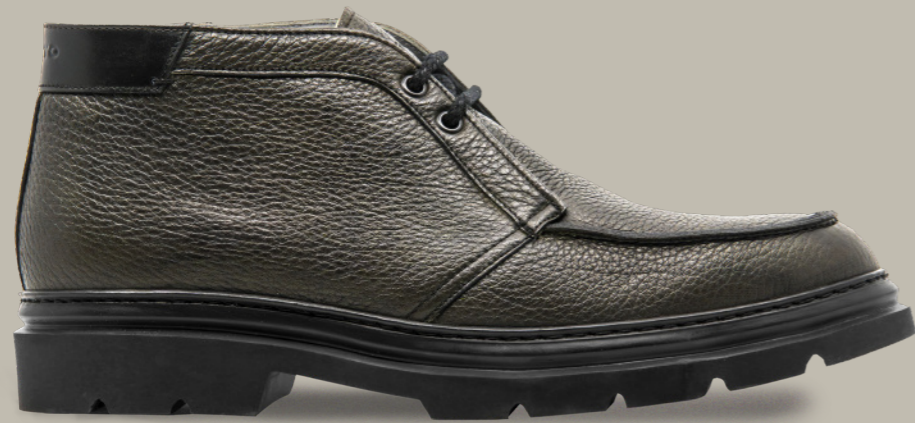
BERGAMO 42340 KAKHI