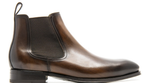
SAINT-ETIENNE 42302 BROWN