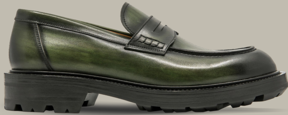
TIBET 42334 LEAF GREEN