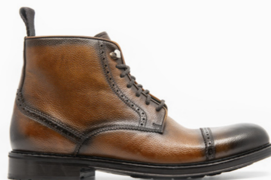
MOSCOW 42320 TAN