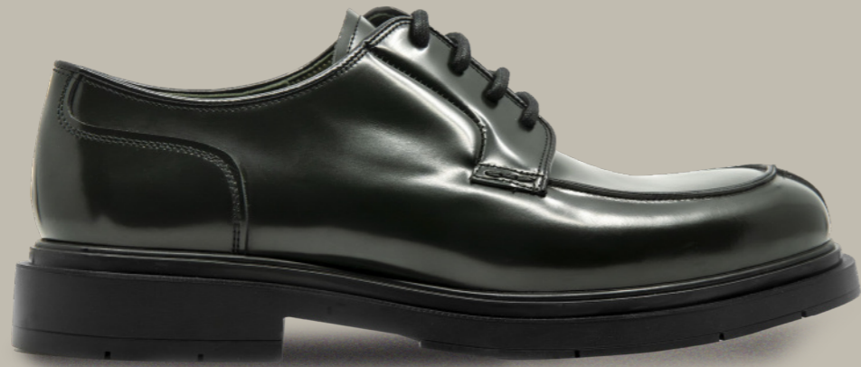
OSLO 42327 DARK GREEN BOTTLED