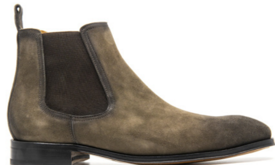
SAINT-ETIENNE 42301 GREEN GREY