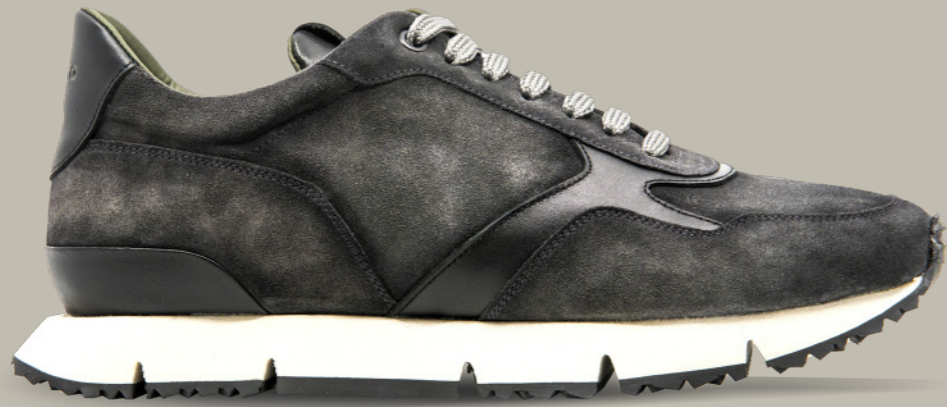
LEWIS 42348 ANTRACITE