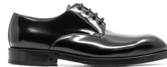
EAGLE 42298 BLACK