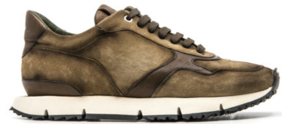
LEWIS 42346 TAUPE