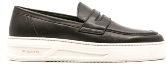
MONACO 42349 TESTA