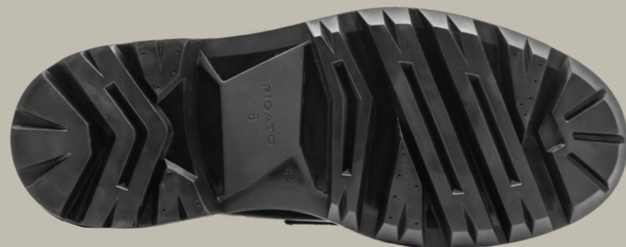
REAL RUBBER OUTSOLE