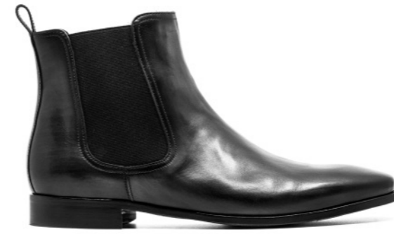
PARIS 42317 DARK GREY