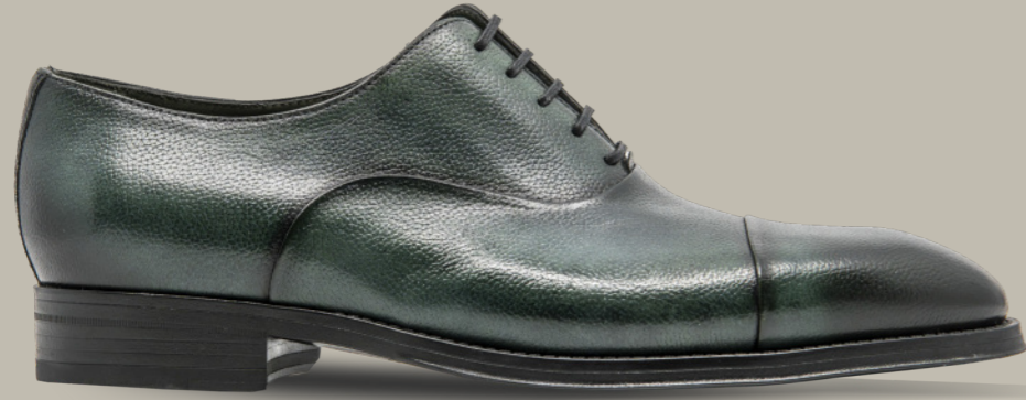
MORITZ 42316 GREEN GRASS