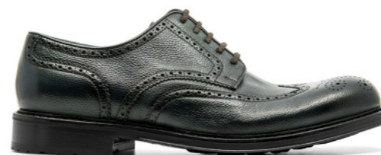
MOSCOW 42322 GREEN BOTTLE