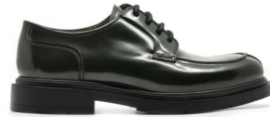
OSLO 42327 DARK GREEN BOTTLED