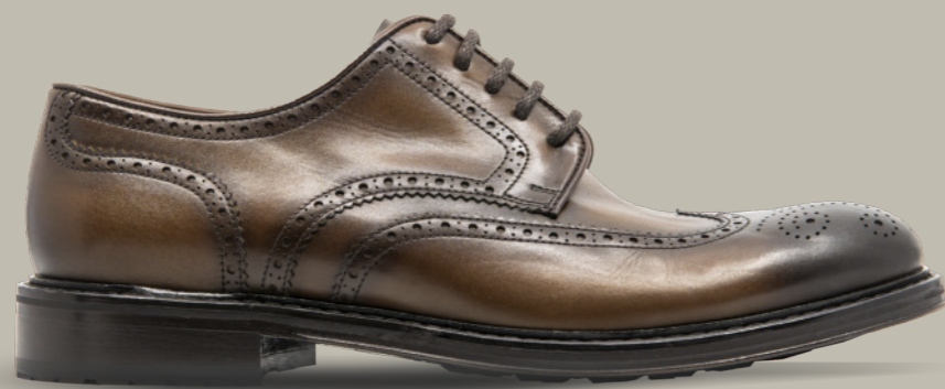
MOSCOW 42321 TAUPE