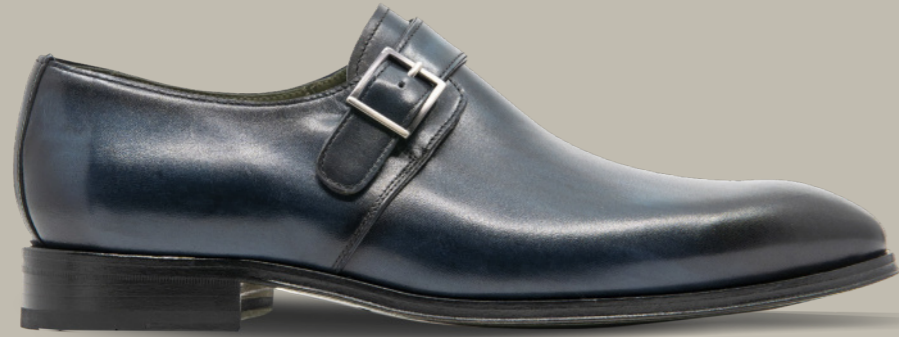
SAINT-ETIENNE 42311 NAVY