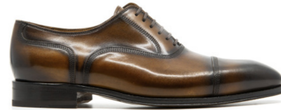
SAINT-ETIENNE 42306 COGNAC