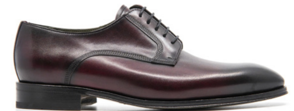
SAINT-ETIENNE 42313 BURGUNDY