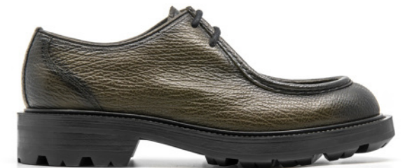
TIBET 42332 KAKHI