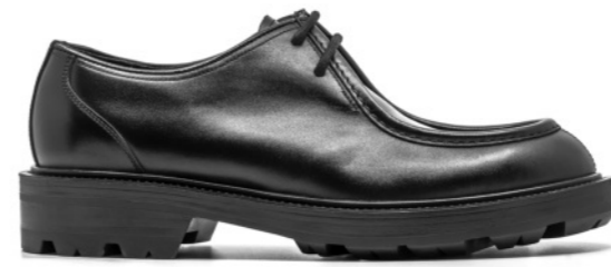
TIBET 42333 BLACK