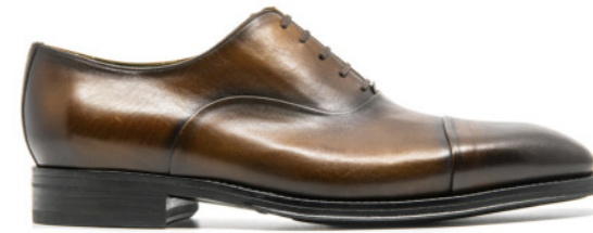
MORITZ 42315 COGNAC