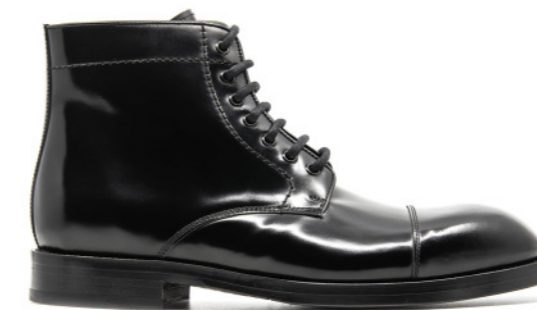
EAGLE 42299 BLACK