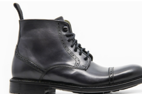
MOSCOW 42319 DARK GREY