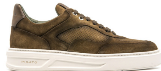
MONACO 42352 CHESNUT