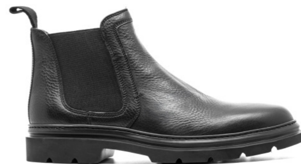
BERGAMO 42343 BLACK