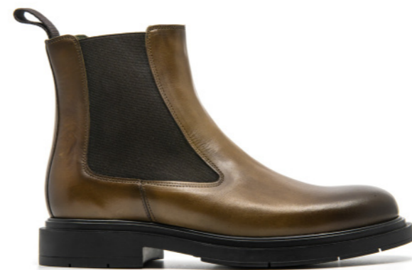
OSLO 42329 TAUPE