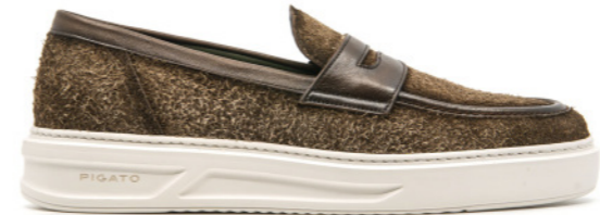
MONACO 42350 TERRA