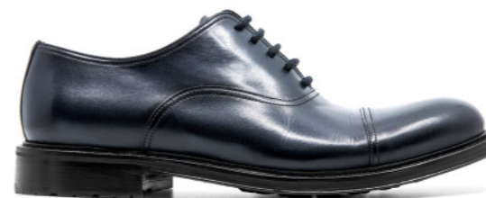
MOSCOW 42324 DARK NAVY