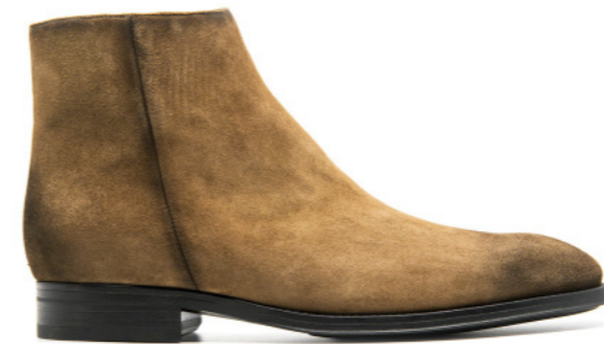
MORITZ 42303 CHESNUT