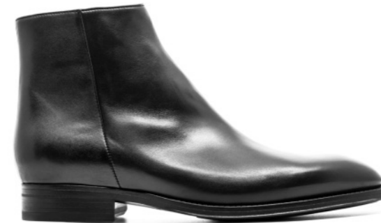
MORITZ 42304 BLACK