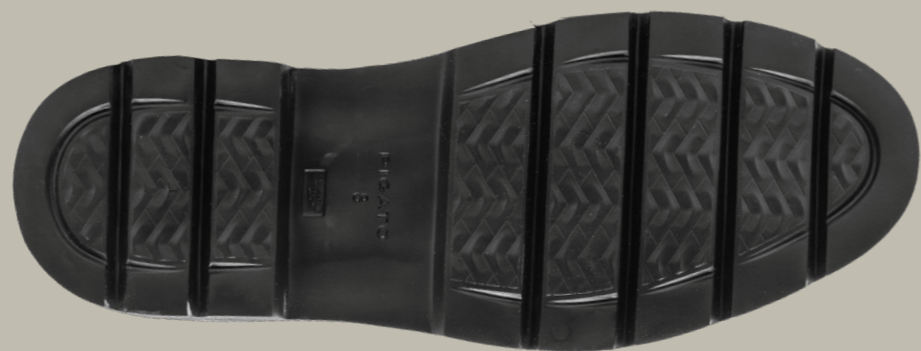
EVA LIGHT OUTSOLE