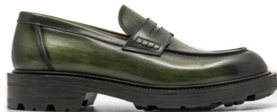
TIBET 42334 LEAF GREEN