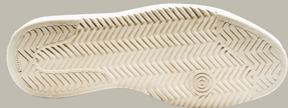
EVA LIGHT OUTSOLE