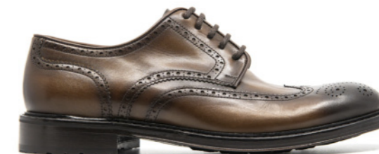
MOSCOW 42321 TAUPE