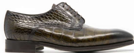
SAINT-ETIENNE 42308 KAKHI