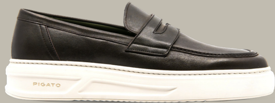
MONACO 42349 TESTA