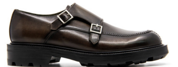
TIBET 42337 TAUPE