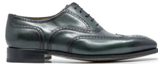
SAINT-ETIENNE 42307 GREEN BOTTLE