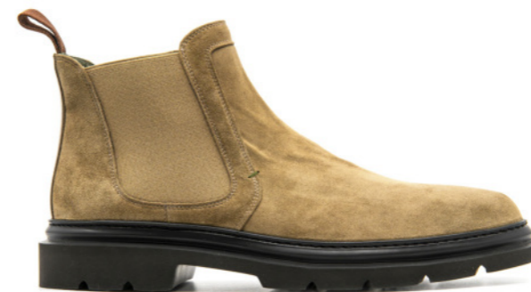
BERGAMO 42342 SAND