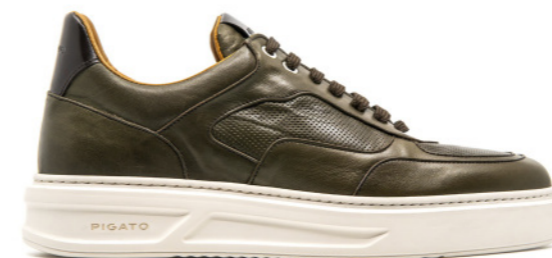
MONACO 42353 OLIVE