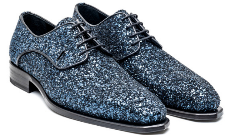
COPERFIELD 42526 BLUE GLITTER