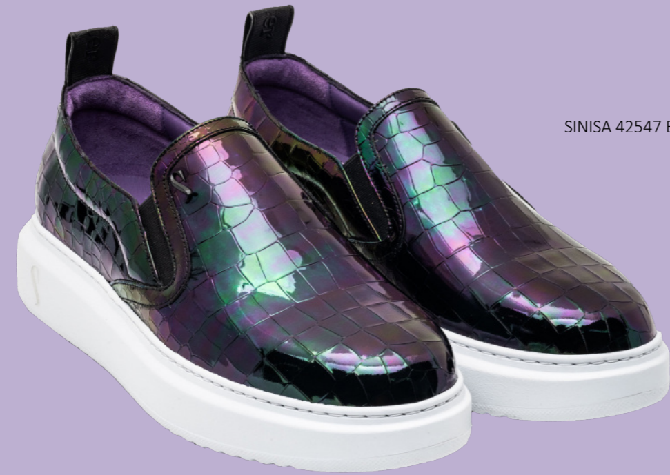
SINISA 42547 BLUE PATENT CROCO