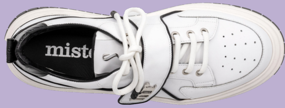
JAMES 42380 WHITE-BLACK