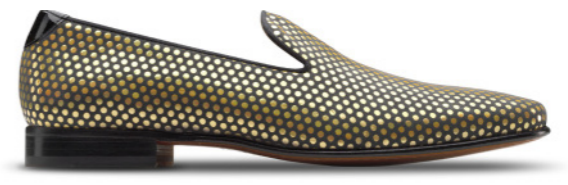
DUKE 41780 GOLD SPOTS CHAROL NEGRO