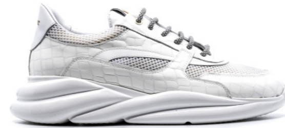
VORTEX 42411 WHITE-CROCO