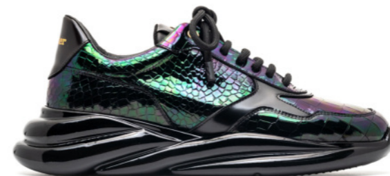
VORTEX 42557 PETROL CROCO PATENT