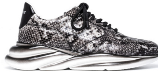
VORTEX 42555 GREY/BLACK SNAKE