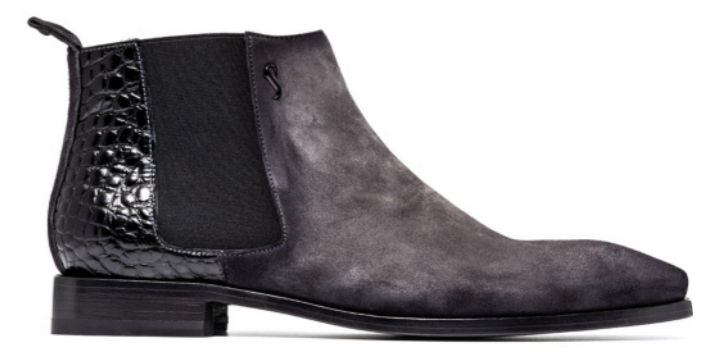
ROCKER 42520 BRUSHED GREY SUEDE / BLACK CROCO