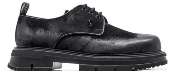
HYBRID 42362 BLACK BRUSHED SUEDE