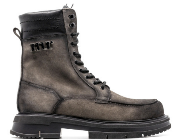
HYBRID 42357 GREENGREY SUEDE