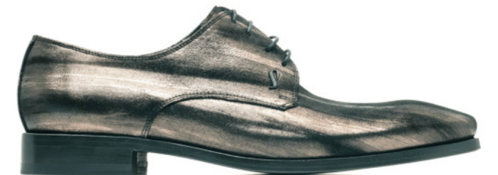
ROCKER 42524 LAMINATED GRAFITO