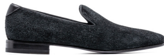
DUKE 42390 BLACK-STRIPPED