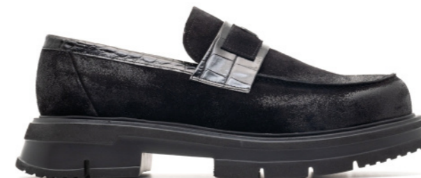
HYBRID 42518 BLACK BRUSHED SUEDE / CROCO