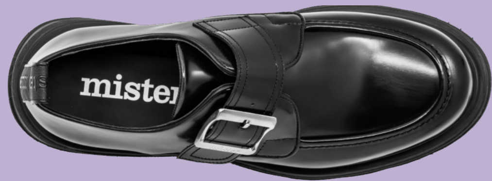
HYBRID 42360 BLACK-ANTIK