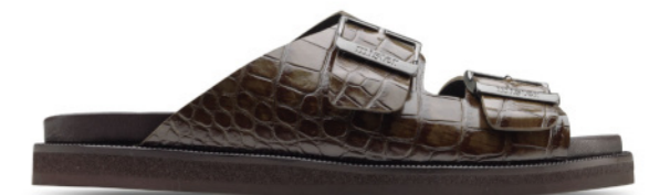
MIAMI 42032 KHAKI-CROCO