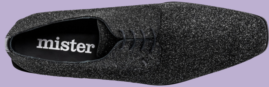
ROCKER 42370 GLITTER