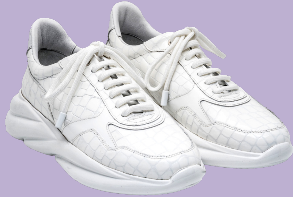
VORTEX 42554 WHITE PATENT CROCO