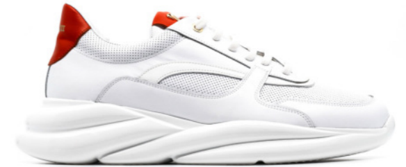
VORTEX 42410 WHITE-ORANG