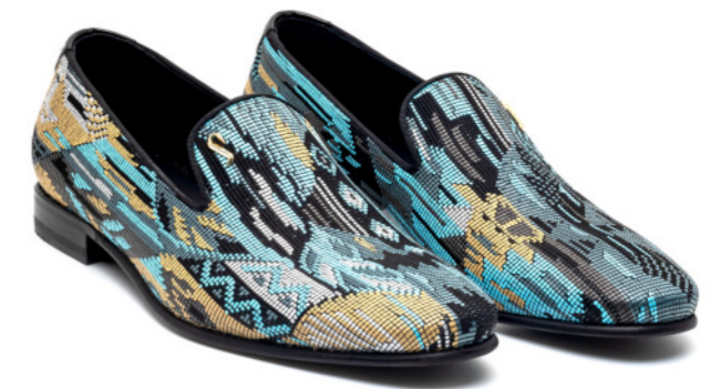
DUKE 42545 PSYCHODELIC RAFIA BLUE BEIG