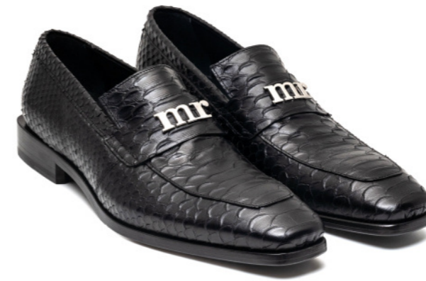
ROCKER 42522 BLACK SNAKE