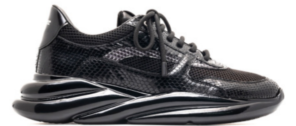
VORTEX 42413 BLACK SNAKE / MESH