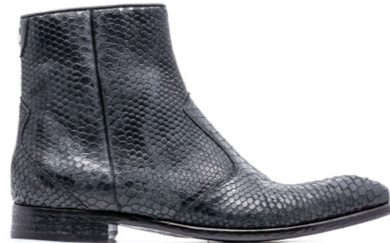
JIMI 42376 BLACK SNAKE