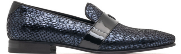
DUKE 42539 LAMINATED BLUE SNAKE