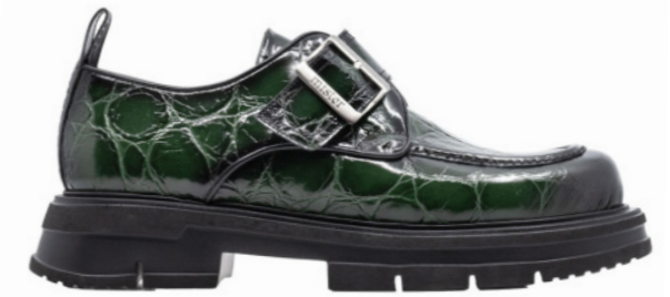
HYBRID 42359 GREEN-CROCO