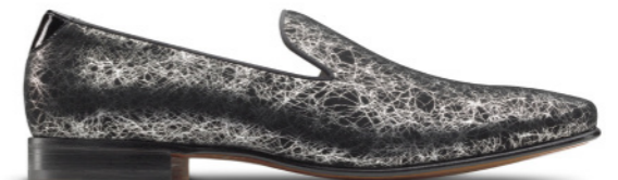
DUKE 41781 BLACK SILVER STORM