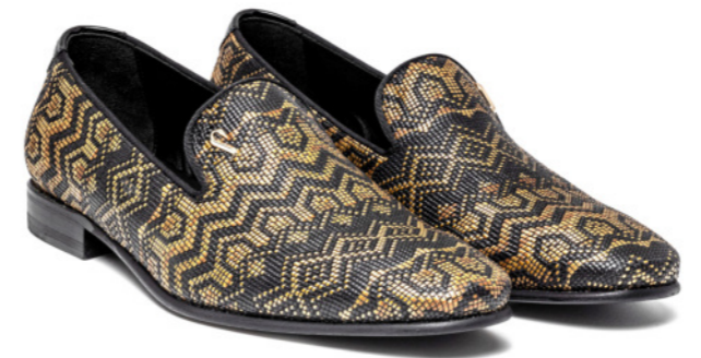
DUKE 42544 RAFIA BLACK-BRONZE