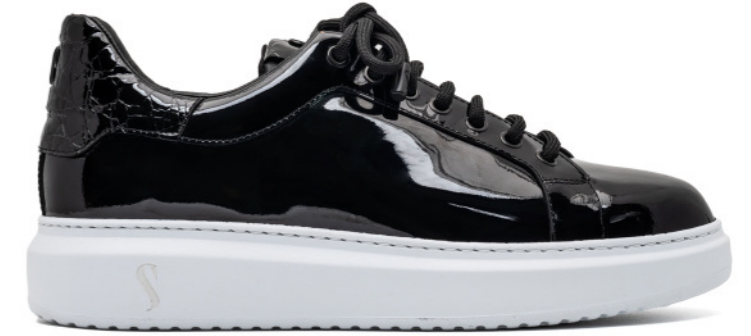
SINISA 42550 BLACK PATENT - CROCO DETAIL