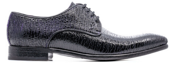
JIMI 42372 KRACKED PATENT