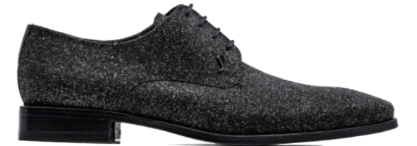
ROCKER 42370 GLITTER