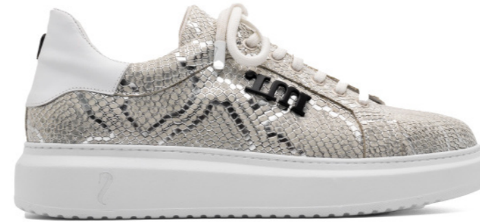
SINISA WHITE/SILVER SNAKE