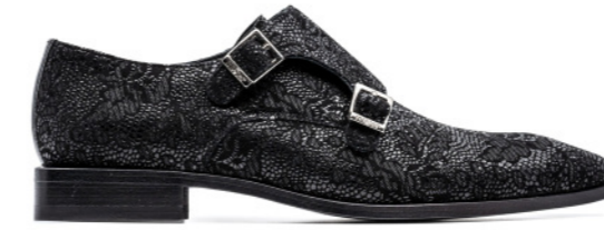
ROCKER 42369 FLOWER-PRINTING