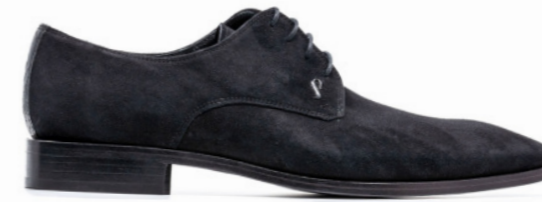
ROCKER 42112 BLACK-SUEDE