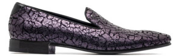
DUKE 42537 CRAKED LILAC METALIZED