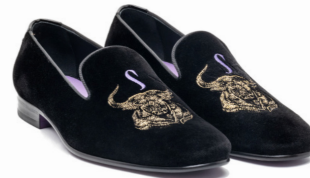
DUKE 42536 BLACK VELVET BULL DETAIL