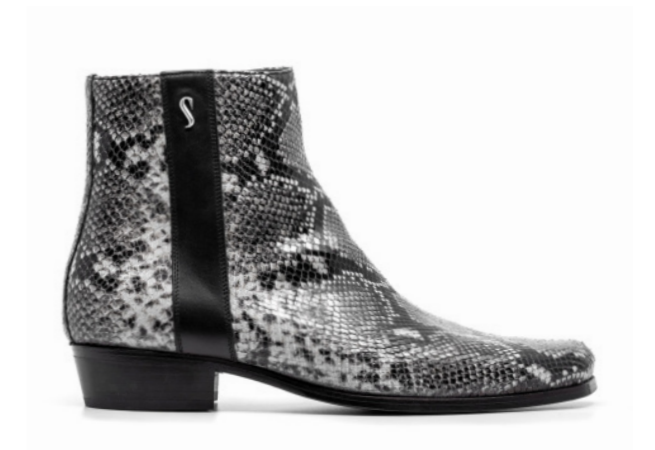
LENNY 42102 GREY-SNAKE