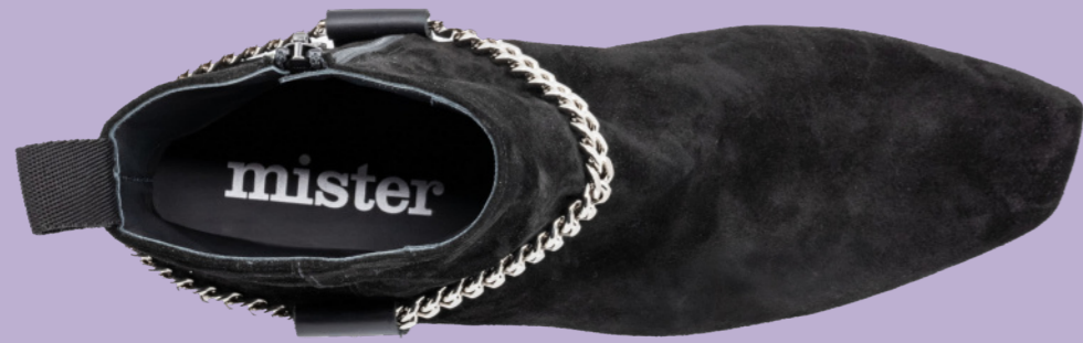
LENNY 42365 BLACK-SUEDE