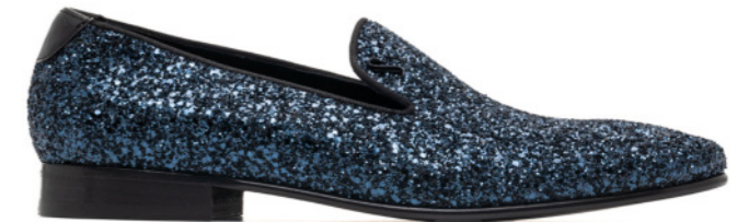
DUKE 42533 BLUE GLITTER