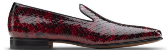
DUKE 41778 RED LAVA-SNAKE