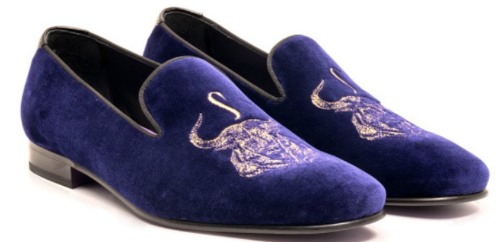
DUKE 42535 LILAC VELVET BULL DETAIL