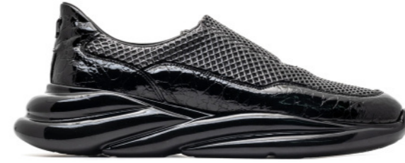
VORTEX 42559 BLACK CROCO PATENT/BLACK MESH