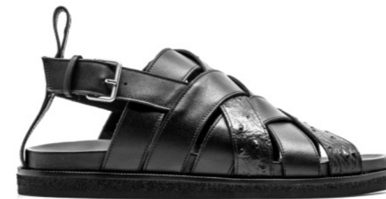
MIAMI 42389 BLACK-OSTRICH