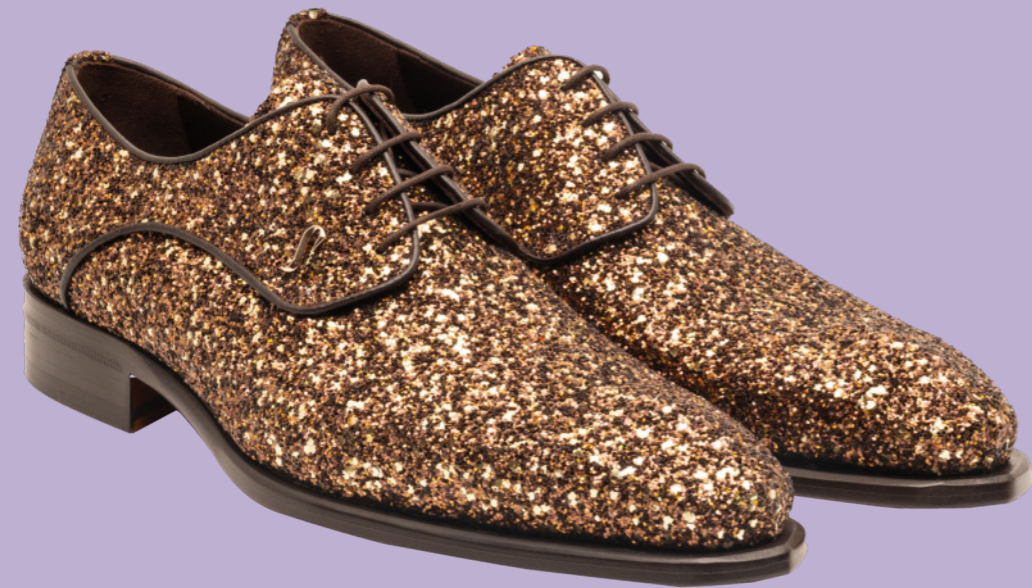
COPERFIELD 42529 GOLD GLITTEER