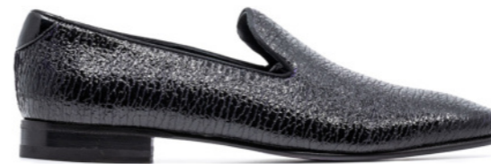
DUKE 42391 KRAKED-PATENT