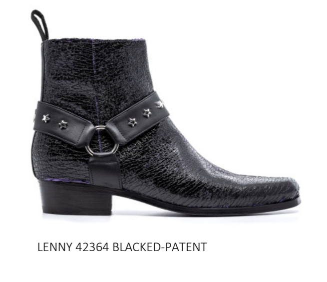
LENNY 42364 BLACKED-PATENT