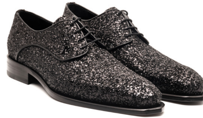
COPERFIELD 42527 BLACK GLITTER