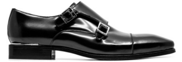
ROCKER 42117 BLACK-ANTIC