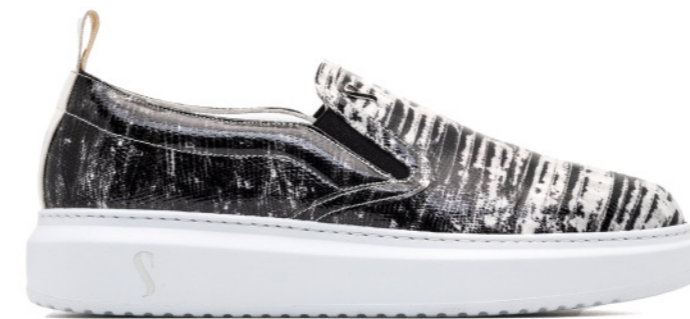
SINISA 42548 BLACK / WHITE PATENT LIZARD