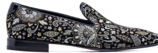
DUKE 42393 CACHEMIRE BLACK-WHITE