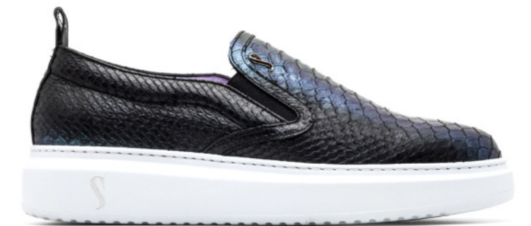
SINISA 42549 WATER PYTHON