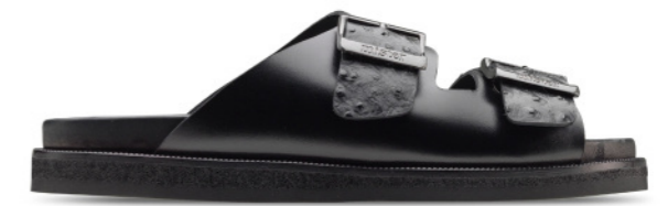
MIAMI 42034 BLACK-OSTRICH