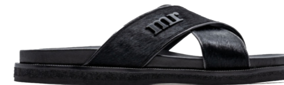
MIAMI 42388 BLACK-PONY