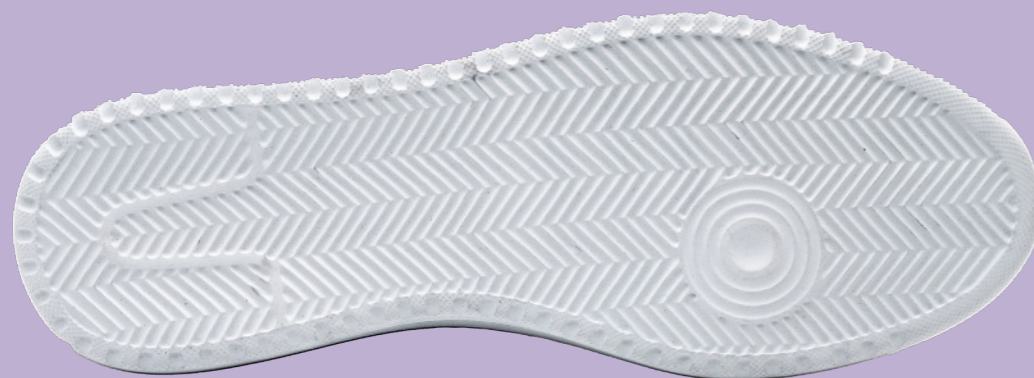
MOULDED LIGHT EVA OUTSOLE