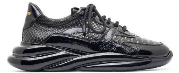
VORTEX 42412 BLACK PATENT LEATHER / BLACK GOLD SNAKE