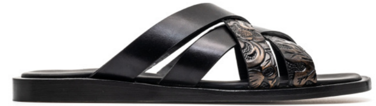
MARBELLA 42562 DARK BROWN TREE PRINTED / BLACK