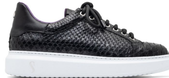
SINISA 42552 - BLACK PYTHON SNAKE