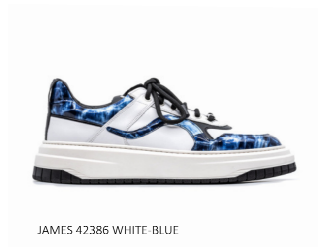
JAMES 42386 WHITE-BLUE