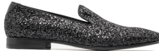
DUKE 42530 BLACK GLITTER