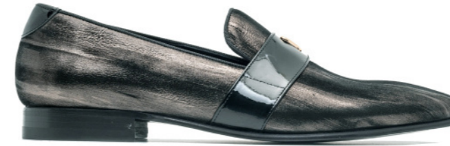
DUKE 42540 LAMINATED GRAFITO