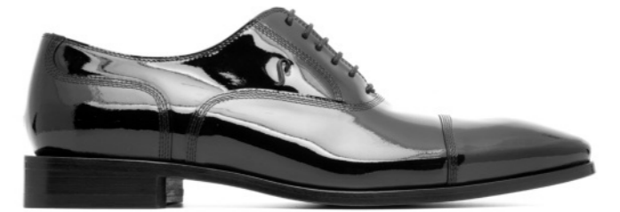
ROCKER 42523 BLACK PATENT