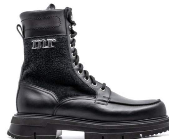
HYBRID 42358 BLACK