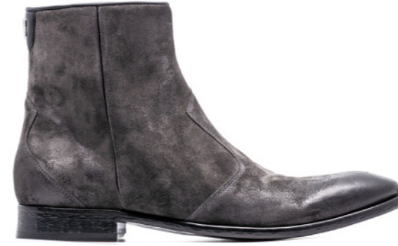
JIMI 42378 GREY-SUEDE