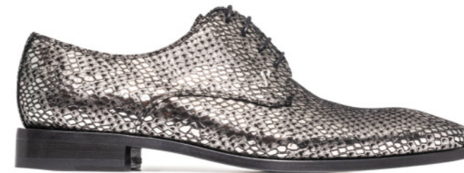
ROCKER 42525 LAMINATED SILVER SNAKE