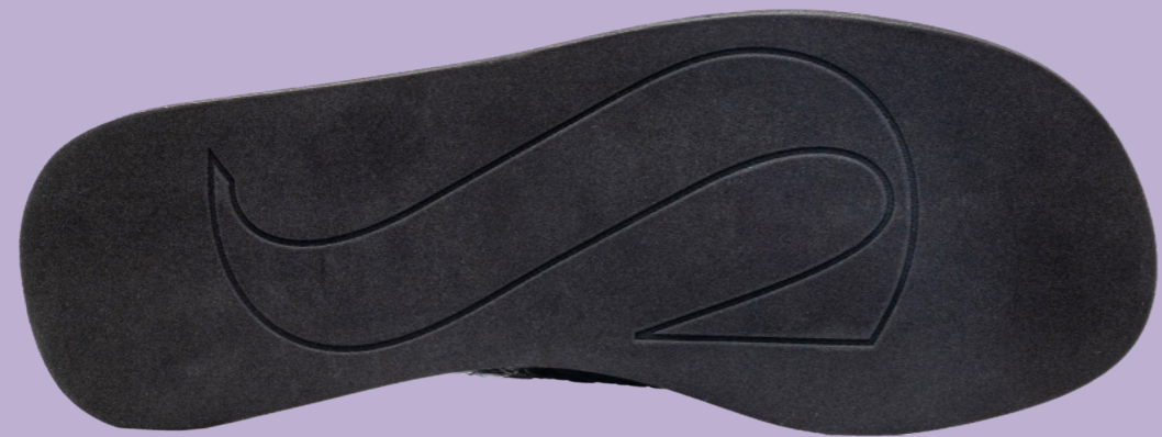
RUBBER + EVA OUTSOLE