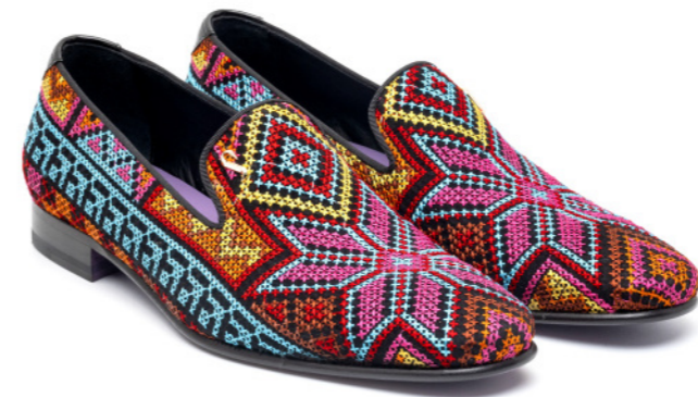
DUKE 42542 CROSS STITCH MULTICOLOR