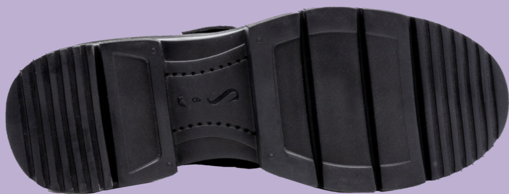
EVA LIGHT SOLE