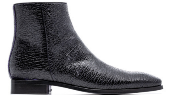
ROCKER 42367 KRACKED-PATENT