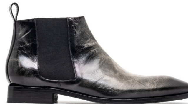
ROCKER 42521 VINTAGE EFFECT ANTRACITE