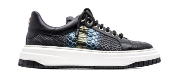
JAMES 42384 WATER-PYTON SNAKE