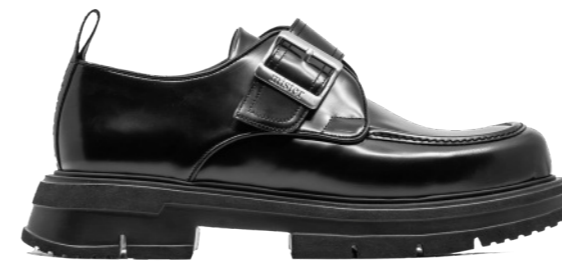
HYBRID 42360 BLACK-ANTIK