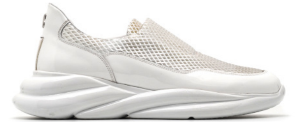
VORTEX 42558 WHITE PATENT-SILVER MESH