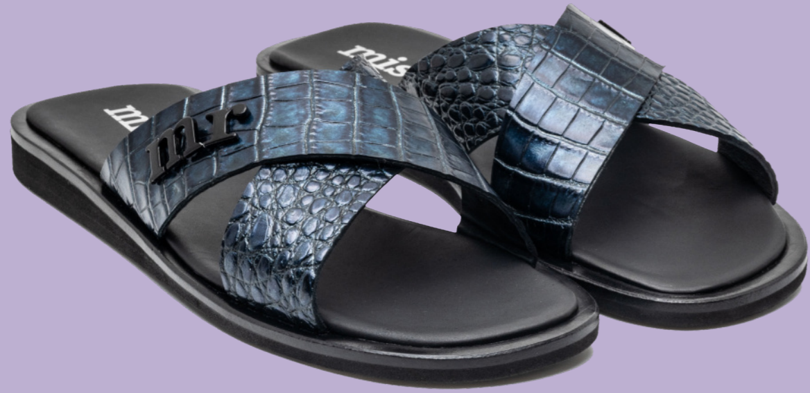
MARBELLA 42560 NAVY CROCO