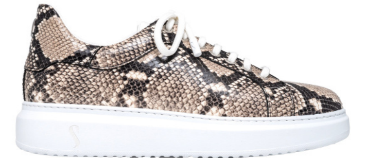
SINISA 42551 BEIG / BLACK SNAKE