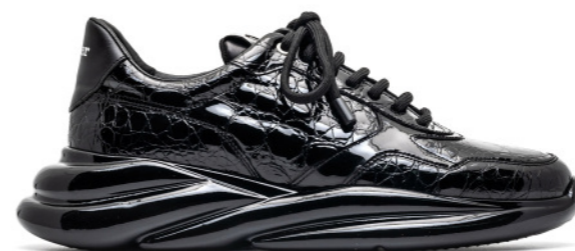
VORTEX 42556 BLACK CROCO PATENT