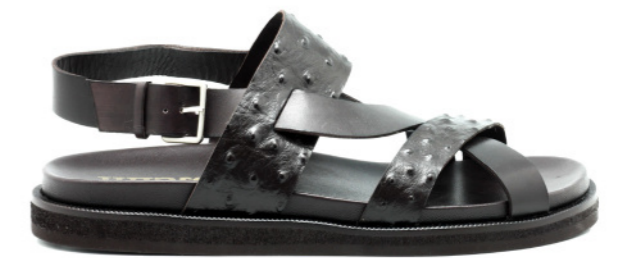
MIAMI 42036 TAN-OSTRICH