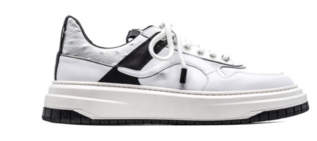
JAMES 42385 WHITE-BLACK