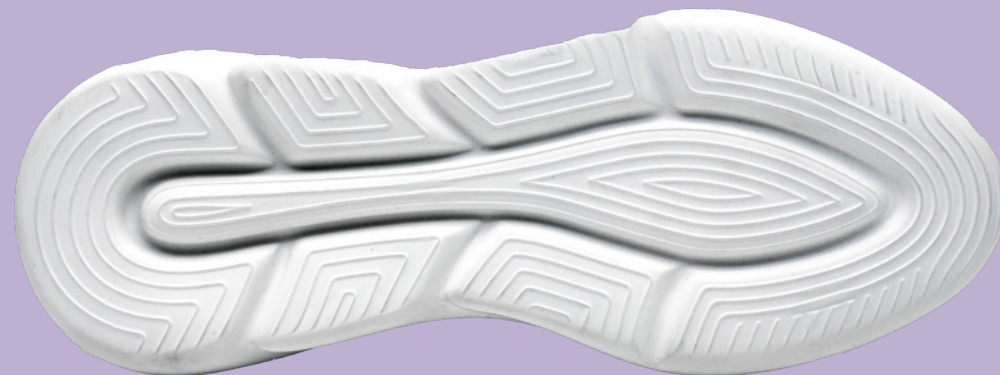
EVA LIGHT OUTSOLE