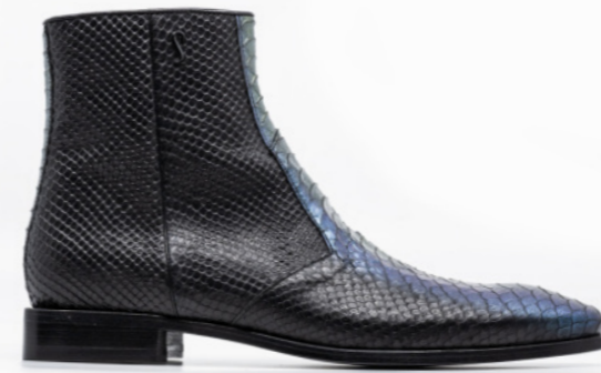
ROCKER 42368 WATER-SNAKE