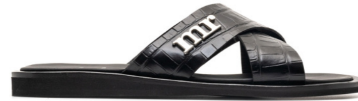
MARBELLA 42561 BLACK CROCO