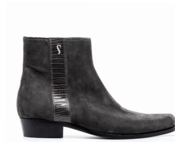
LENNY 42101 GREY-SUEDE