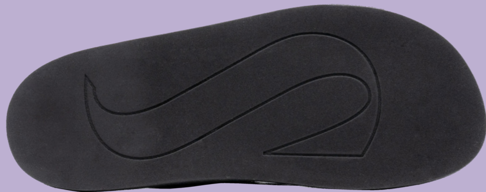
EVA LIGHT OUTSOLE