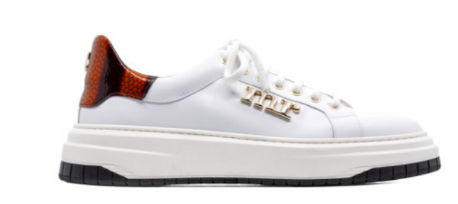
JAMES 42382 WHITE