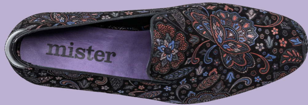
DUKE 42392 CACHEMIRE-MULTICOLOR