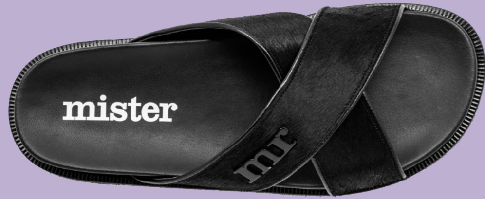
MIAMI 42388 BLACK-PONY