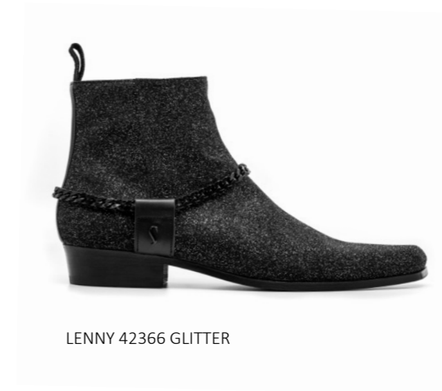
LENNY 42366 GLITTER