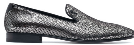
DUKE 42538 LAMINATED SILVER SNAKE