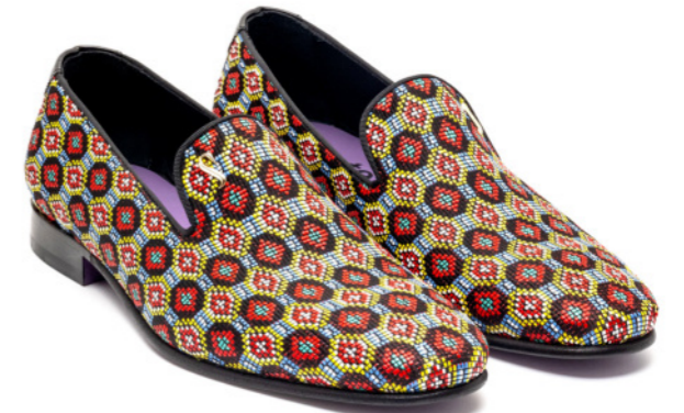
DUKE 42543 DIAMOND RAFIAZZZ MULTICOLOR