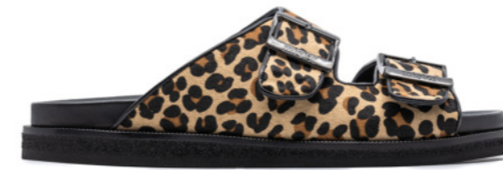
MIAMI 42387 LEOPARD-PONY